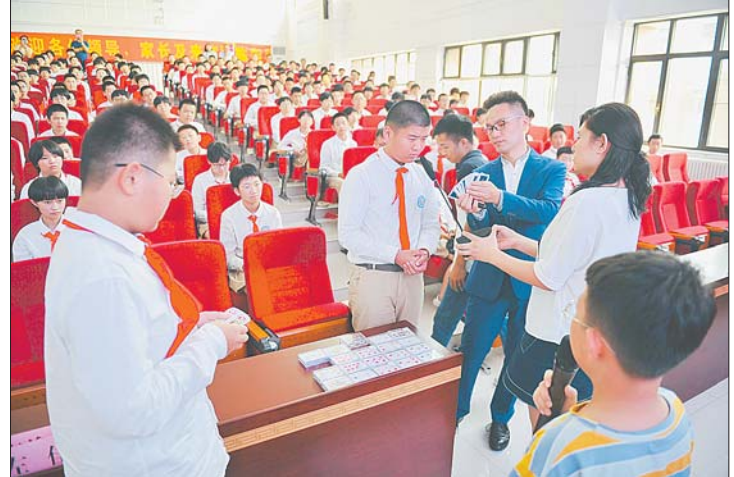
姜老师在授课中。资料片