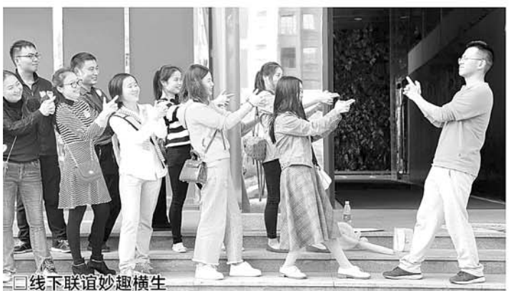
线下联谊妙趣横生

端午假期进入倒计时,催婚大军即将进入“战场”,作为被催婚的单身,想好怎么应对了吗?与其与父母斗智斗勇,不如在线上万人相亲会上找一个对象回家过节。微信交友社区举办的线上万人相亲会,汇聚了济南各行业数万名优质单身,开展“线上互动+线下联谊”的交友模式,快速拓宽单身的社交圈子!咨询热线:82967520