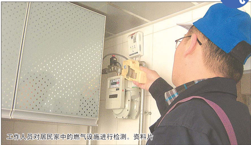
工作人员对居民家中的燃气设施进行检测。资料片

“出行前请认真检查室内燃气设施，重点检查煤气表、表前阀、灶前阀、胶管有无漏气、老化、脱落、松动现象。”济南港华相关负责人介绍，居民出门旅行前一定要关闭灶前阀，并尽量保持室内（尤其是厨房）通风，不要紧闭窗户，要保持室内空气流动。同时，如果家中燃气设施存在安全隐患，请主动联系燃气公司及时进行整改。