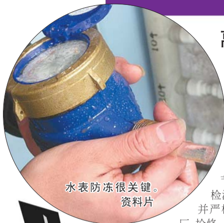
水表防冻很关键。 资料片