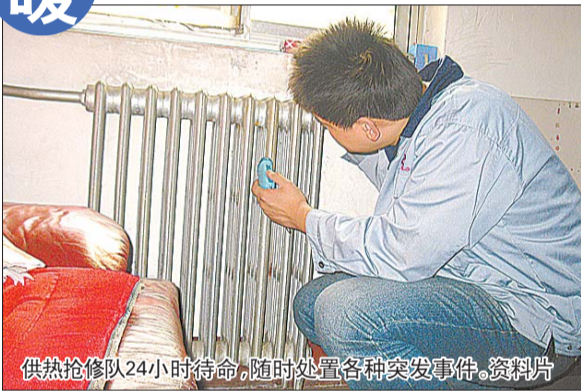
供热抢修队24小时待命，随时处置各种突发事件。资料片