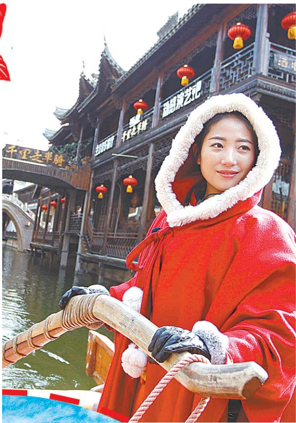
台儿庄古城贺岁活动精彩纷呈。

春节出游，要的就是一个喜庆热闹，在济南逛着不过瘾，咱还可以去周边的城市转转走走。近日，山东省旅发委陆续发布各市春节旅游指南，将各地好吃好玩的地方一网打尽，赶紧跟记者来瞅瞅吧。