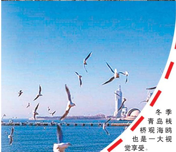
冬季青岛栈桥观海鸥也是一大视觉享受。